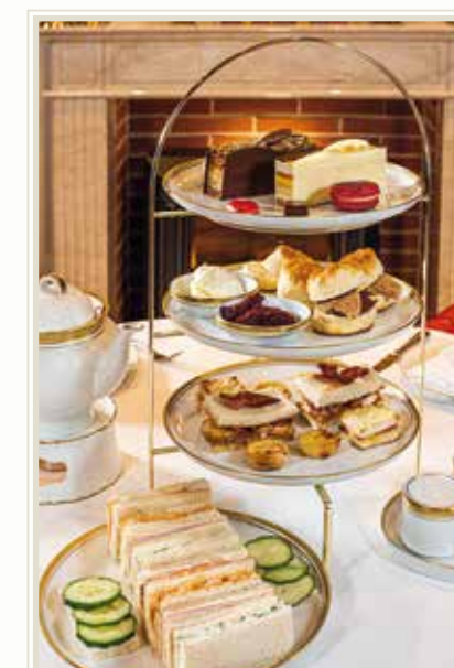
Auch für Geburtstagsfeiern buchbar!

Tea Time: 39 € pro Person Tea Time Deluxe (inkl. 1 Glas Champagner): 48 € pro Person