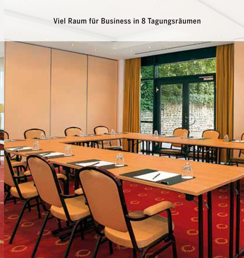
Viel Raum für Business in 8 Tagungsräumen