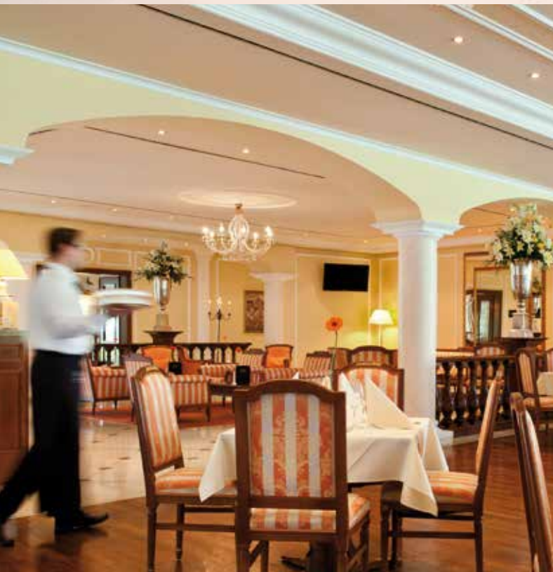
Klassische Eleganz im VICTOR'S RESTAURANT