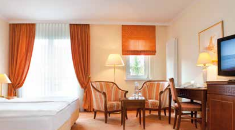
Komfortable Zimmer und Suiten