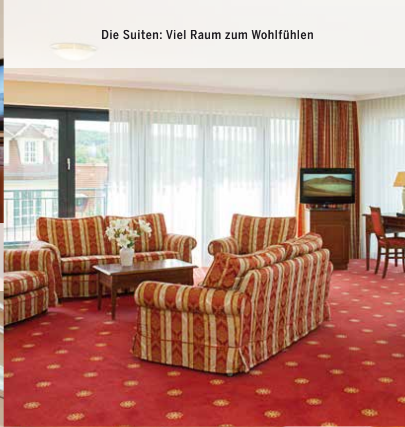
Die Suiten: Viel Raum zum Wohlfühlen