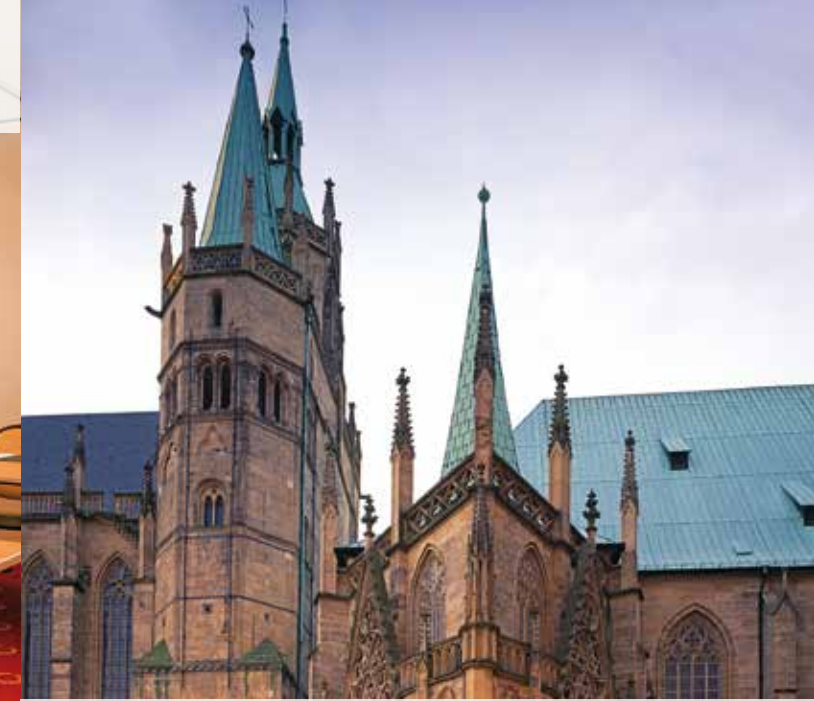
Die Innenstadt mit dem Erfurter Dom ist in wenigen Minuten zu erreichen