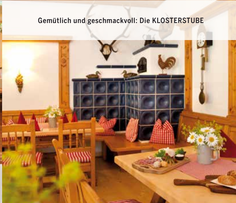
Gemütlich und geschmackvoll: Die KLOSTERSTUBE