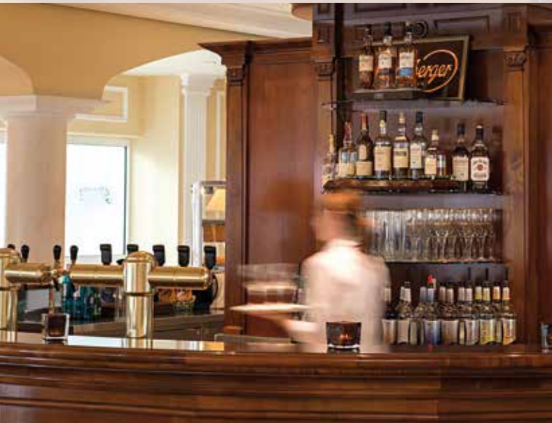
Auf einen Drink in der VICTOR'S BAR