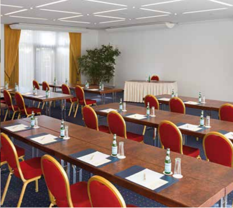
Entspannter Tagen: 3 flexible Veranstaltungsräume