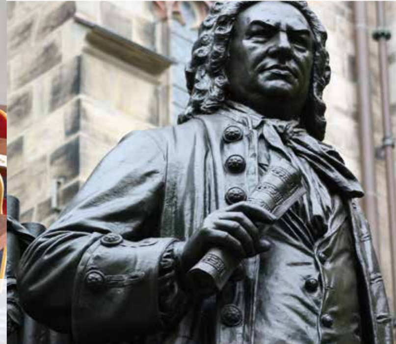
Mittendrin: Zentrale Lage an den Toren zur Altstadt