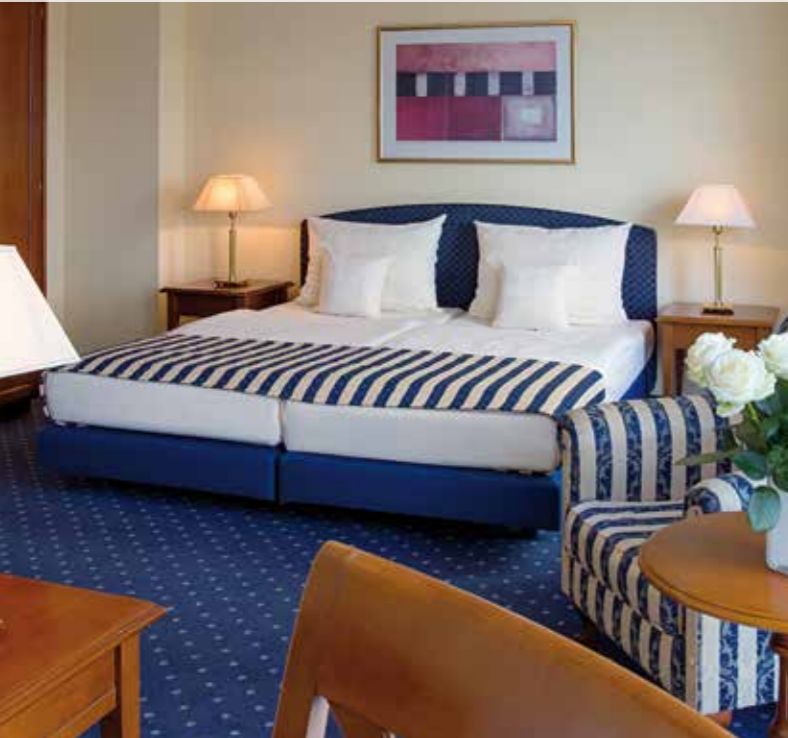
Gemütlich und einladend: Unsere Zimmer und Junior-Suiten