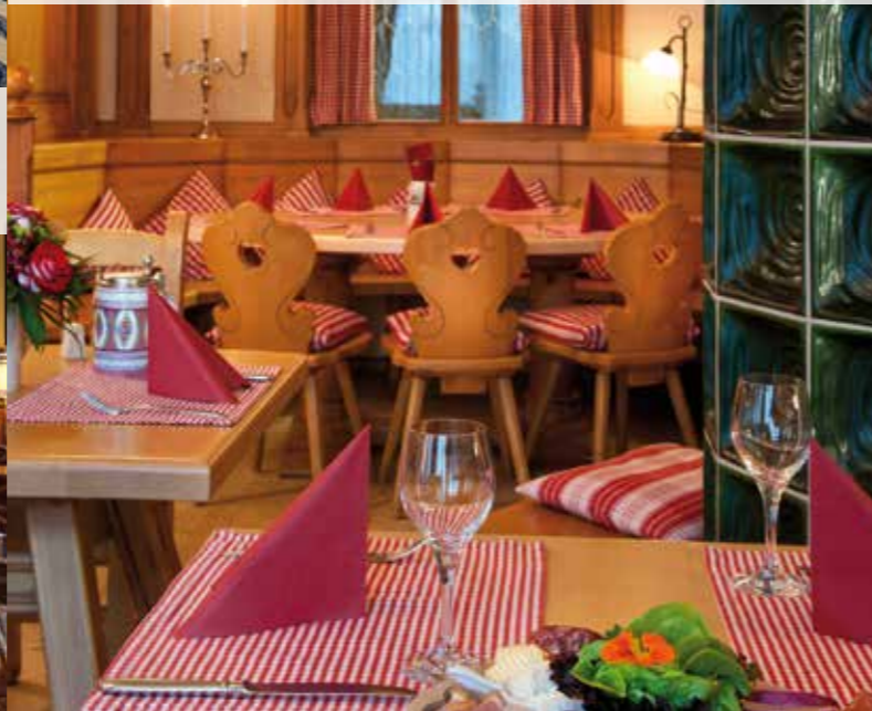
Ein Stückchen Bayern mitten in Leipzig: Die KLOSTERSTUBE