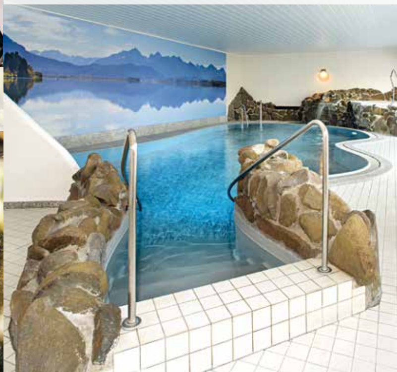
Eintauchen und Abschalten: Der Wellnessbereich mit Schwimmbad