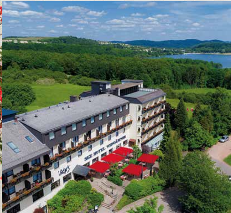
Nur einen Steinwurf vom idyllischen Bostalsee entfernt

Kennen Sie das? Sie betreten ein Hotel und spüren sofort eine authentische Gastlichkeit, die aus tiefstem Herzen kommt. Falls nicht, sollten Sie unbedingt mal im VICTOR'S SEEHOTEL WEINGÄRTNER einchecken.