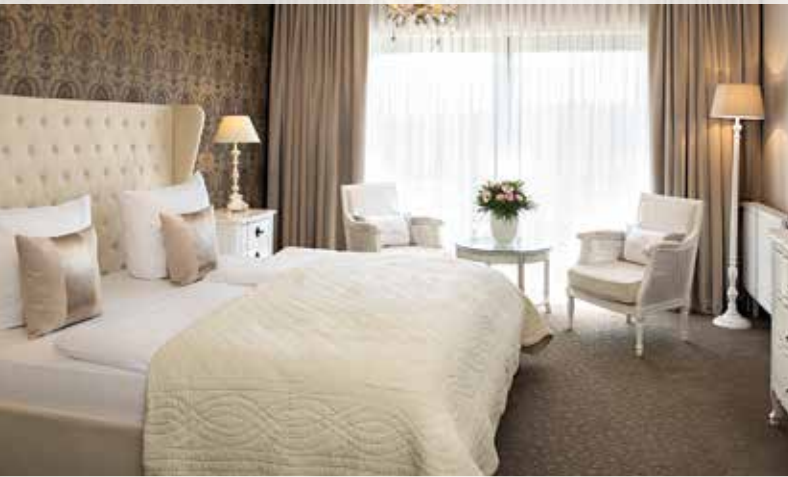
Stilvoller Komfort in unseren Zimmern und Junior-Suiten