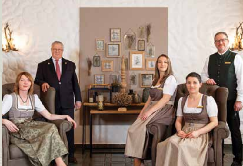
Die Direktion und das gesamte Team heißen Sie Herzlich Willkommen