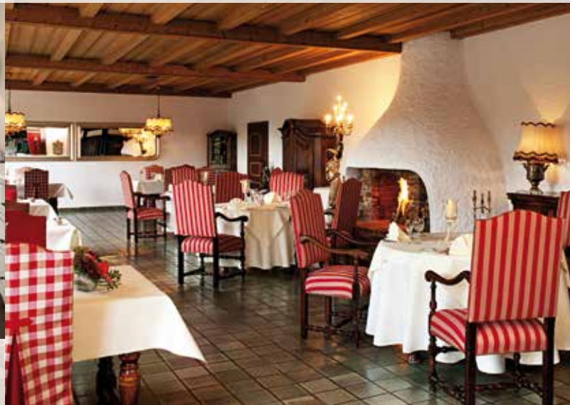
Rustikal und gemütlich: Die KAMINSTUBE