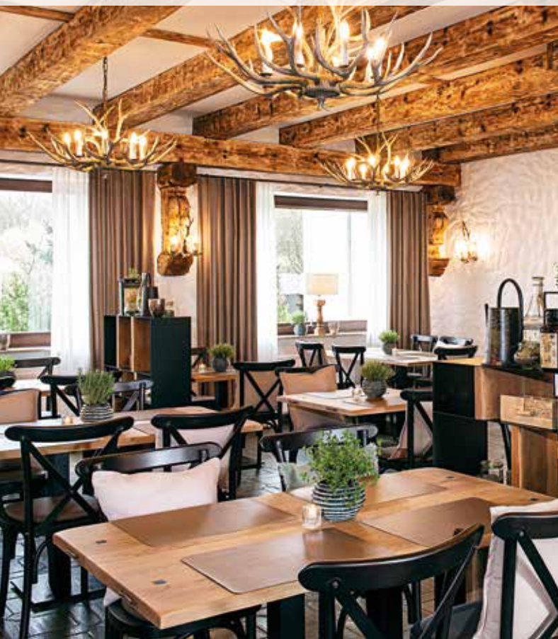
Die KRÄUTERSTUBE in WEINGÄRTNERS GENIESSERSTUBEN