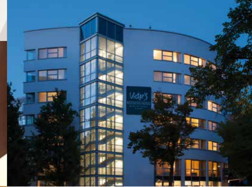
Alle Sightseeing-Highlights bequem erreichbar