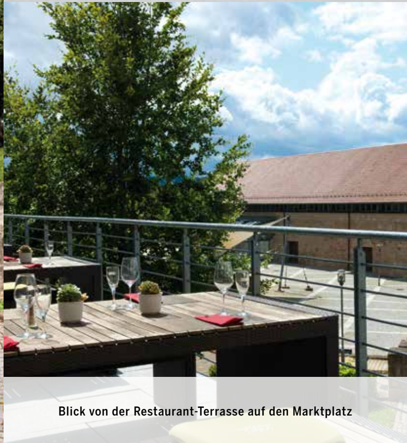
Blick von der Restaurant-Terrasse auf den Marktplatz

Weite Wiesen und Felder, sanfte Hügel, artenreiche Wälder – und mittendrin: das VICTOR'S RESIDENZ-HOTEL TEISTUNGENBURG.