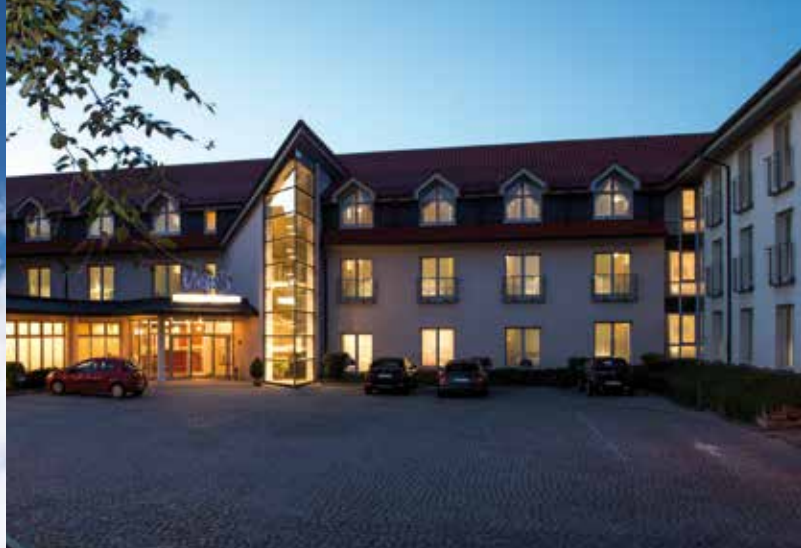
Ruhige Lage im grünen Eichsfeld